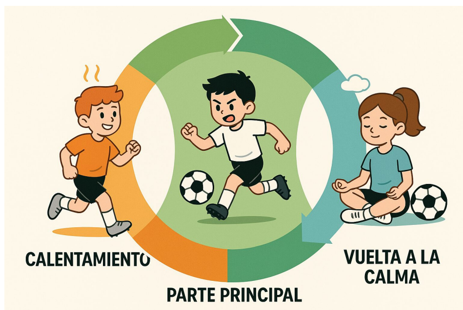
Tabla: Fases de la sesión de entrenamiento en fútbol base

Las fases sesión entrenamiento fútbol base son tres: calentamiento, parte principal y vuelta a la calma . Cada fase cumple un rol clave para mejorar rendimiento, prevenir lesiones y favorecer el aprendizaje.