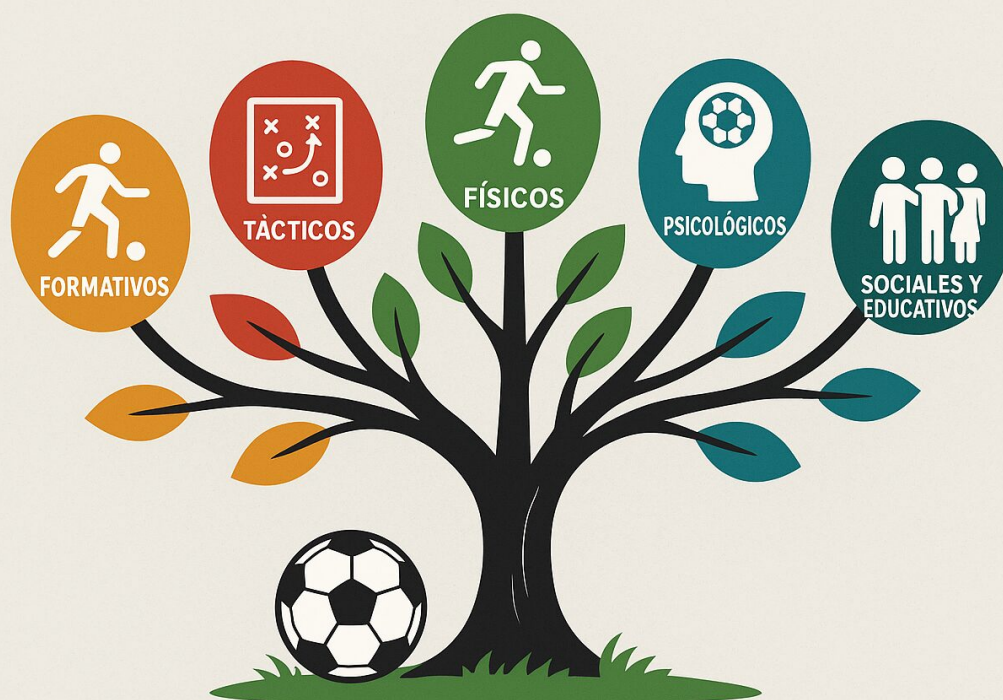
Tabla comparativa de objetivos por dimensión