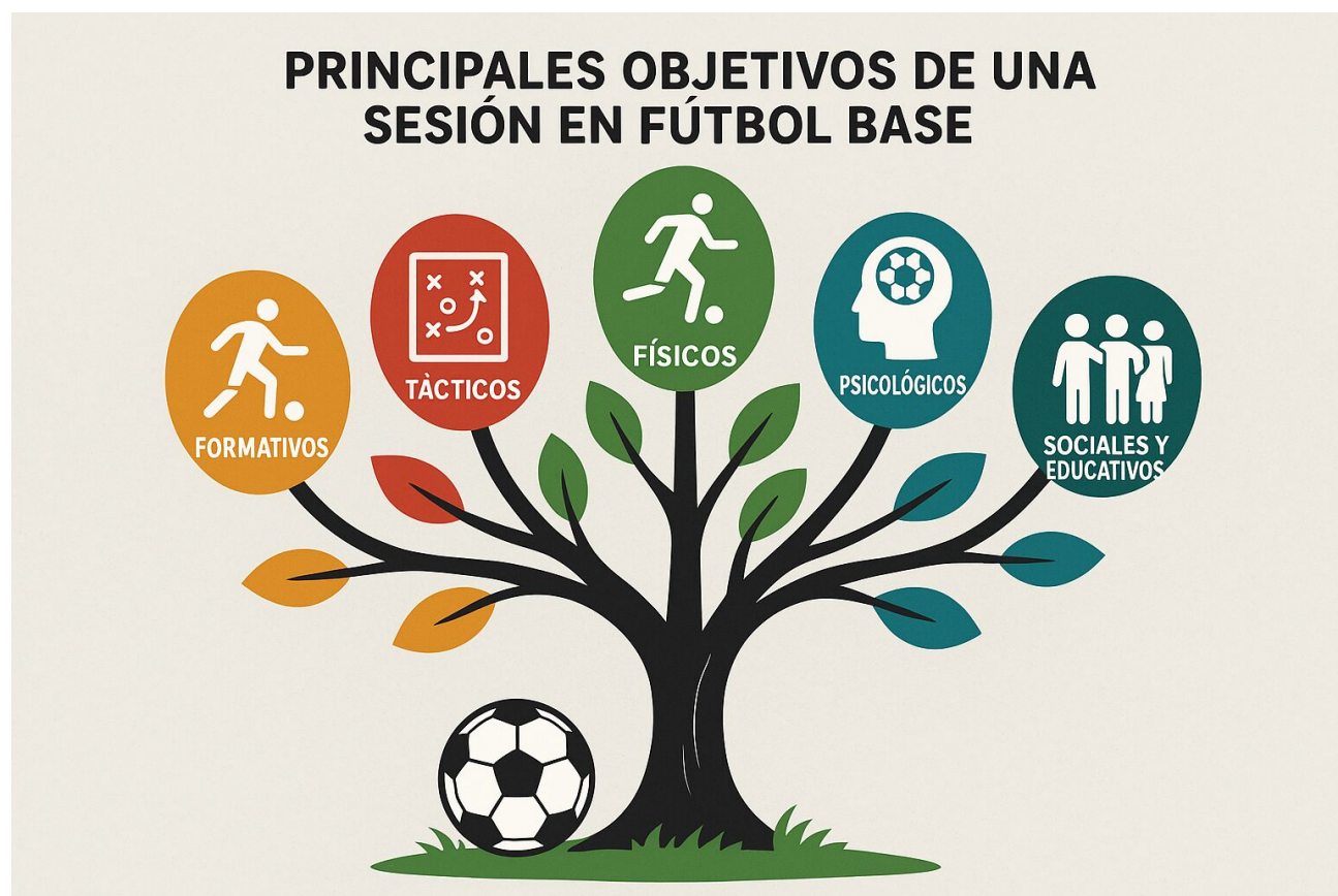
Tabla comparativa de objetivos por dimensión